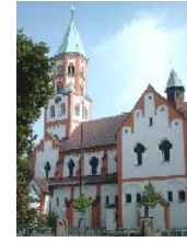
Herz-Jesu Heeren-Werve Pröbstingstraße 11, 59174 Kamen