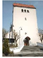
Christ-König Bönen Kirchstraße 17 a, 59199 Bönen