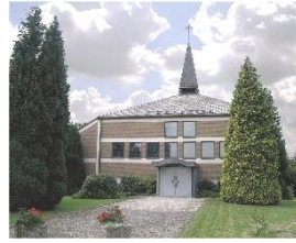
St. Elisabeth Nordbögge Liegnitzer Straße 1, 59199 Bönen