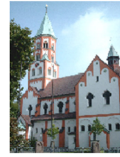
Herz-Jesu Heeren-Werve Pröbstingstraße 11, 59174 Kamen