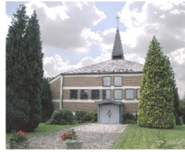
St. Elisabeth Nordbögge Liegnitzer Straße 1, 59199 Bönen