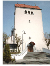
Christ-König Bönen Kirchstraße 17 a, 59199 Bönen