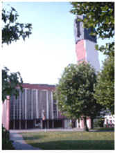
St. Bonifatius Altenbögge Bahnhofstraße 18, 59199 Bönen