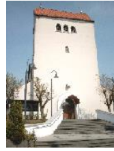
Christ-König Bönen Kirchstraße 17 a, 59199 Bönen