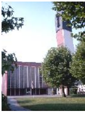
St. Bonifatius Altenbögge Bahnhofstraße 18, 59199 Bönen